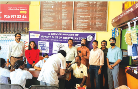
Blood Pressure Check for the passengers in the Cherthala Railway Station