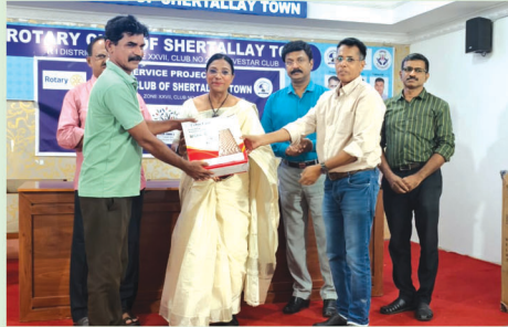
Medical bed for the bed ridden patient