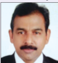
Rtn MPHF PAG Lalg K.