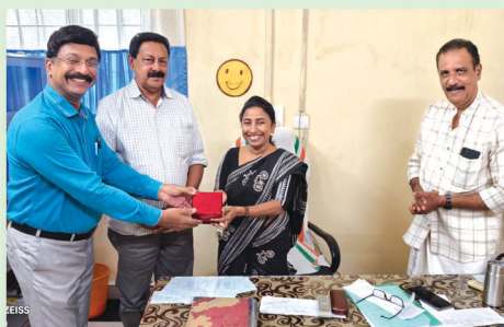
Doctors Day Celebrations