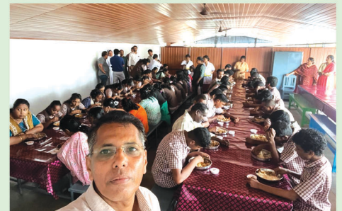
Lunch with Sanjoe Sadan Students, Thuravoor