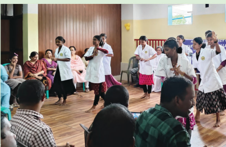
Entertainment Programme By Ayurskethra Students @ Sanjoe Sadan Thuravoor