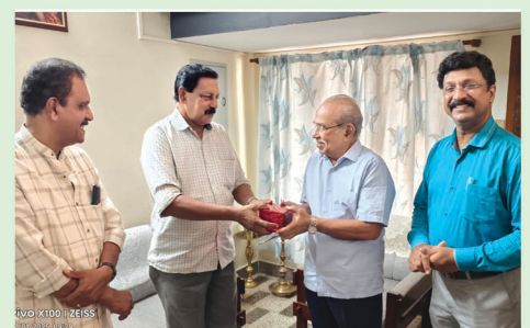
Doctors Day Celebrations