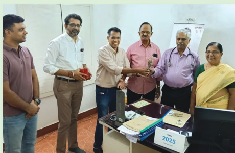
Doctors Day Celebrations