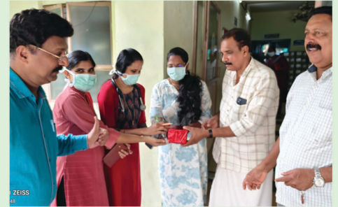
Doctors Day Celebrations