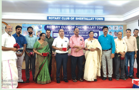
Doctors Day Celebrations. Doctors from the RC Shertallay Town Family were Honoured