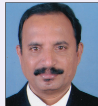
Rtn MPHF PP O.G.Edward