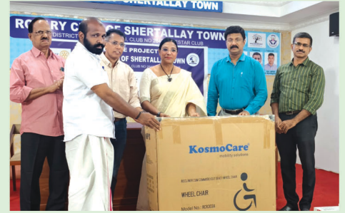
Special Wheel Chair for the bed ridden Patient