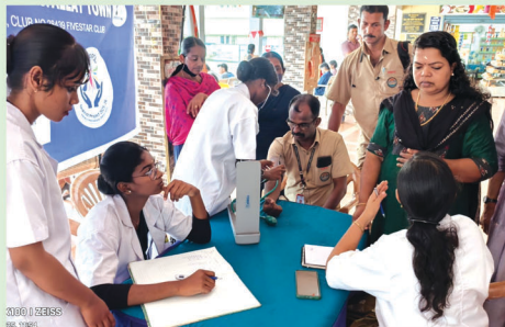
Blood Pressure Check for the passengers in the Cherthala KSRTC Bus Station