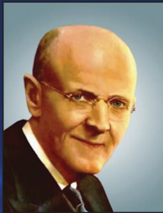
Rtn. Paul Harris RI Founder