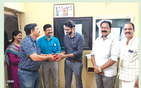
Doctors Day Celebrations