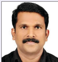
Rtn MPHF Samod P.K.