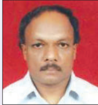
Rtn MPHF Soman M.M.