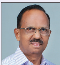
Rtn MPHF PP Er. N.G.Nair