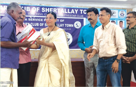
Medical bed for the bed ridden patient